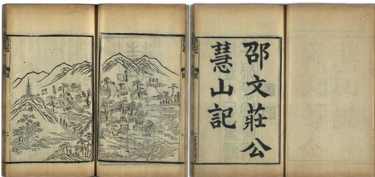
慧山記：四卷 (Huishan Ji: 4 volumes); 慧山記續編：三卷，首一卷 (continuation of Huishan ji: 3 volumes, 1st volume) [Shanghai: 上海還讀樓印行 (Huandulou publish, Qing Guangxu 10th year (1884) 咸豐丁巳重鑄二泉書院藏板]